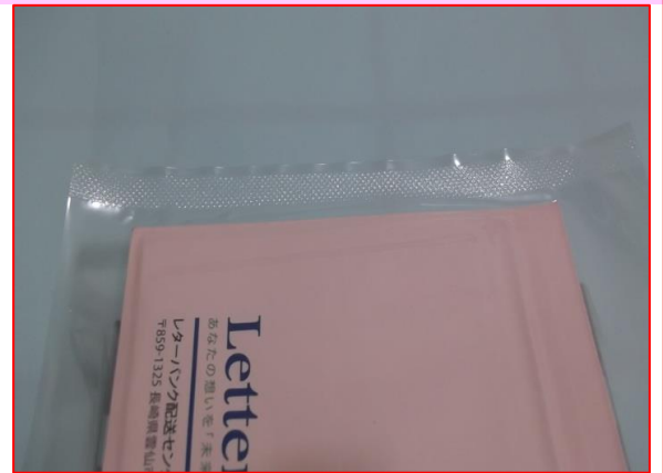
業務用真空包装機での真空パックです。